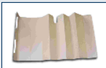
Format offen: 1375 x 580 mm